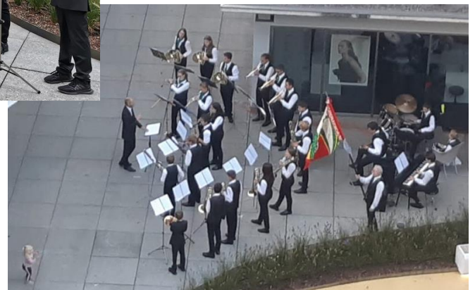
Impressionen Sommerkonzert 2020